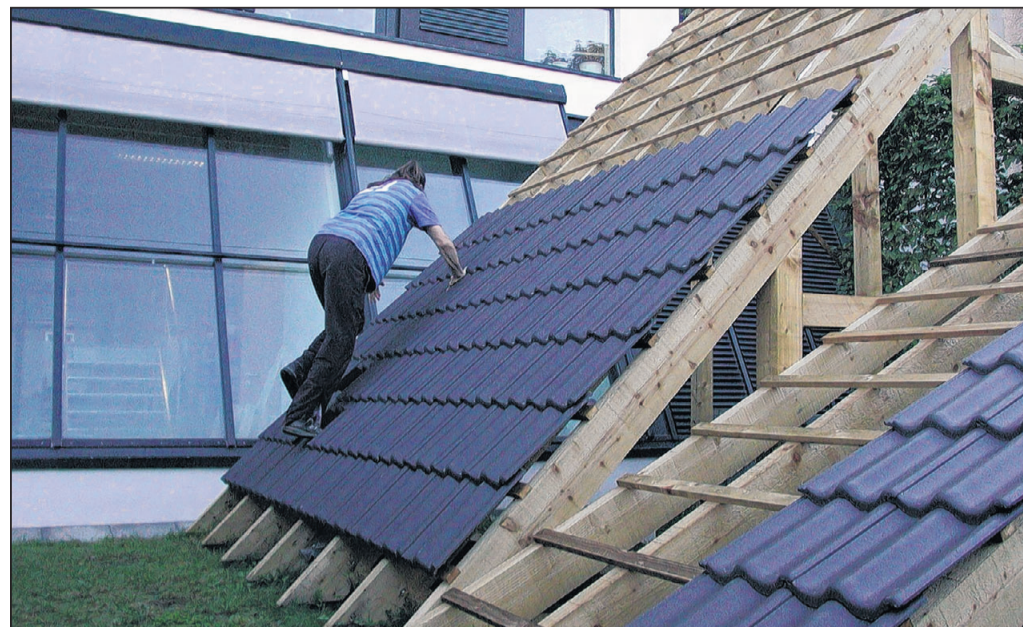
Arbeitsplatzspezifische Rehabilitation am Modul Dach: hier trainiert ein Dachdecker wieder angstfrei zu arbeiten.

Nachdem zum 1. August die ersten Patienten aufgenommen wurden, steigt im September eine große Eröffnungsfeier - geplant ist unter anderem auch, einzelne Rehamaßnahmen live vorzuführen. imp