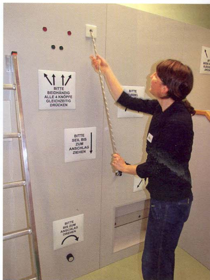
Bei der Eingangserhebung wird zunächst die Leistungsfähigkeit der Patienten ermittelt. Anschließend entwickeln die Therapeuten ein spezifisches Reha-Programm.